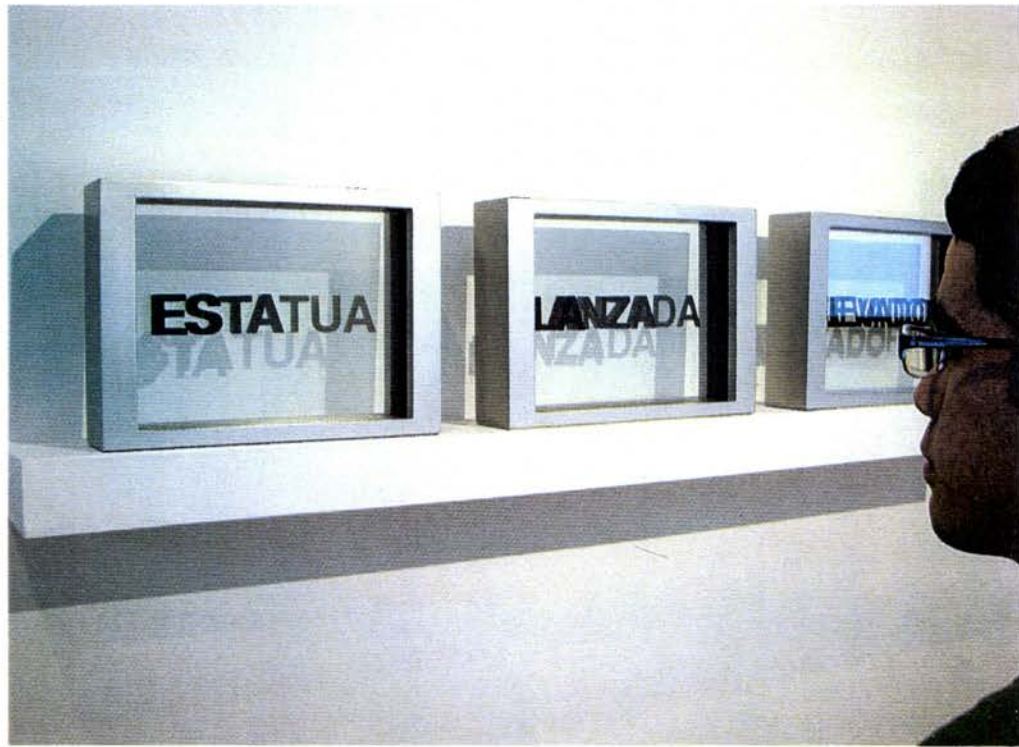
Poliverso (ESTATUA, LANZADA, ELEVADOR), 2007 3 cajas de madera y vidrio, impresión en vinilo. 15 cm. x 20 cm. x 8 cm. (cada una)