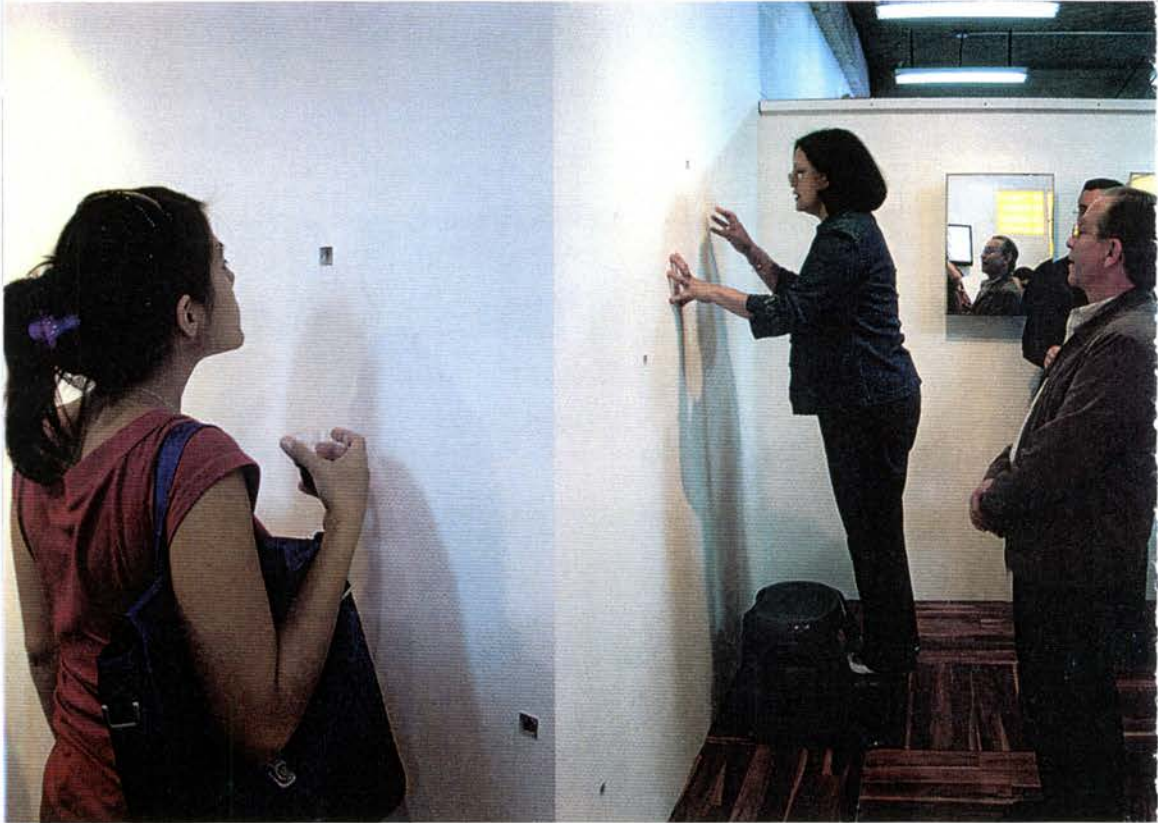
Pbox, 2004 10 cajas de acrílico con poemas. Dimensiones variables