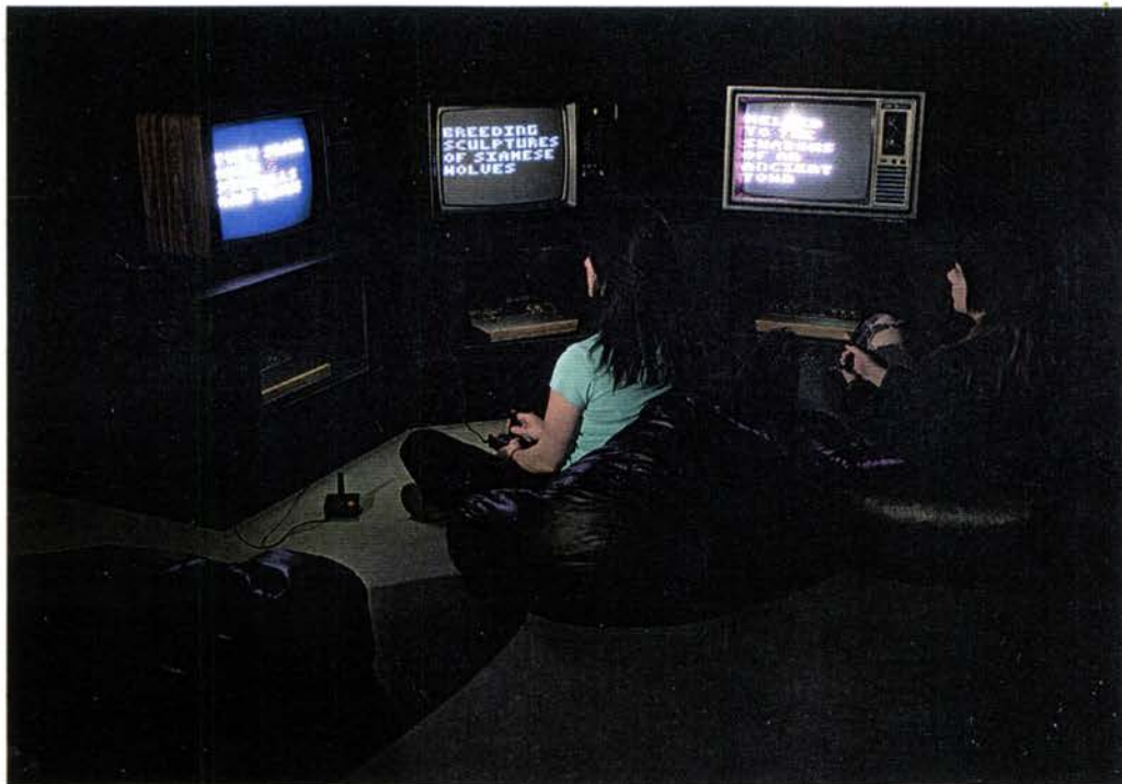
Super Atari Poetry, 2005 3 Atari 2600, Cassettes de Atari, Joysticks, TVs. Dimensiones Variables