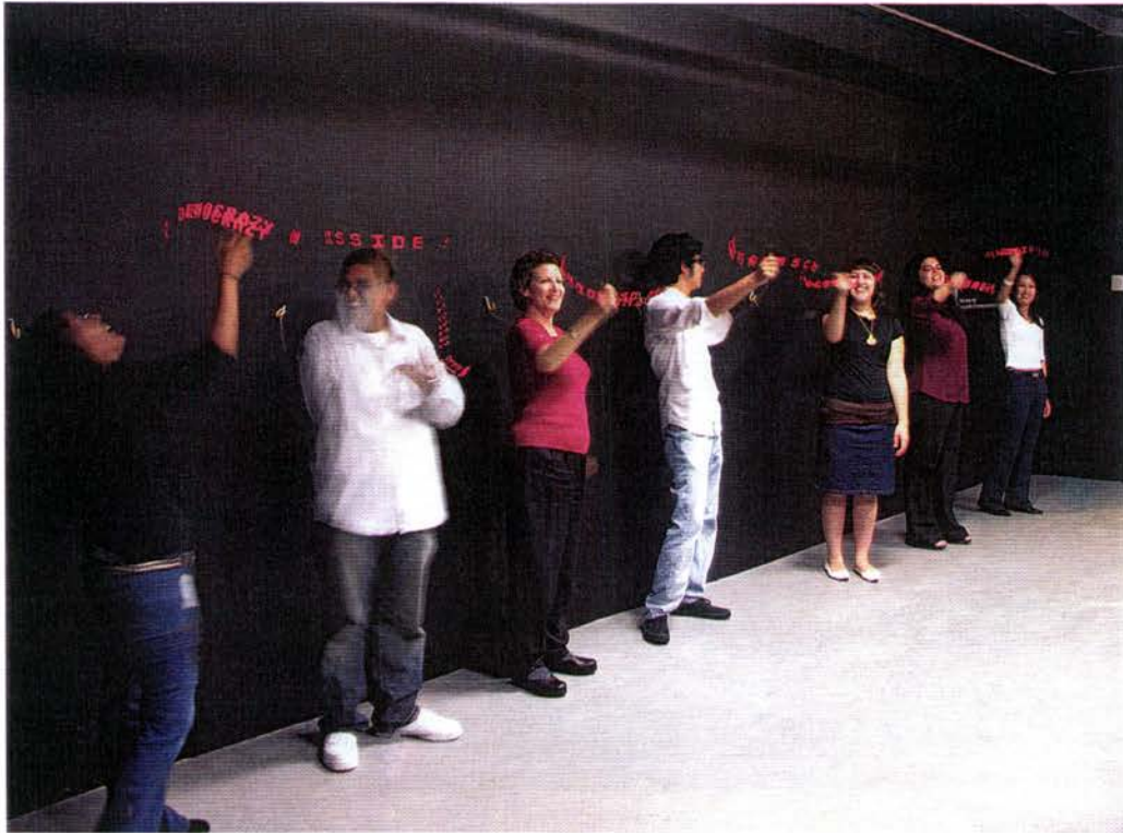
Poetic Words, 2002 7 dispositivos portátiles de LED. Dimensiones variables