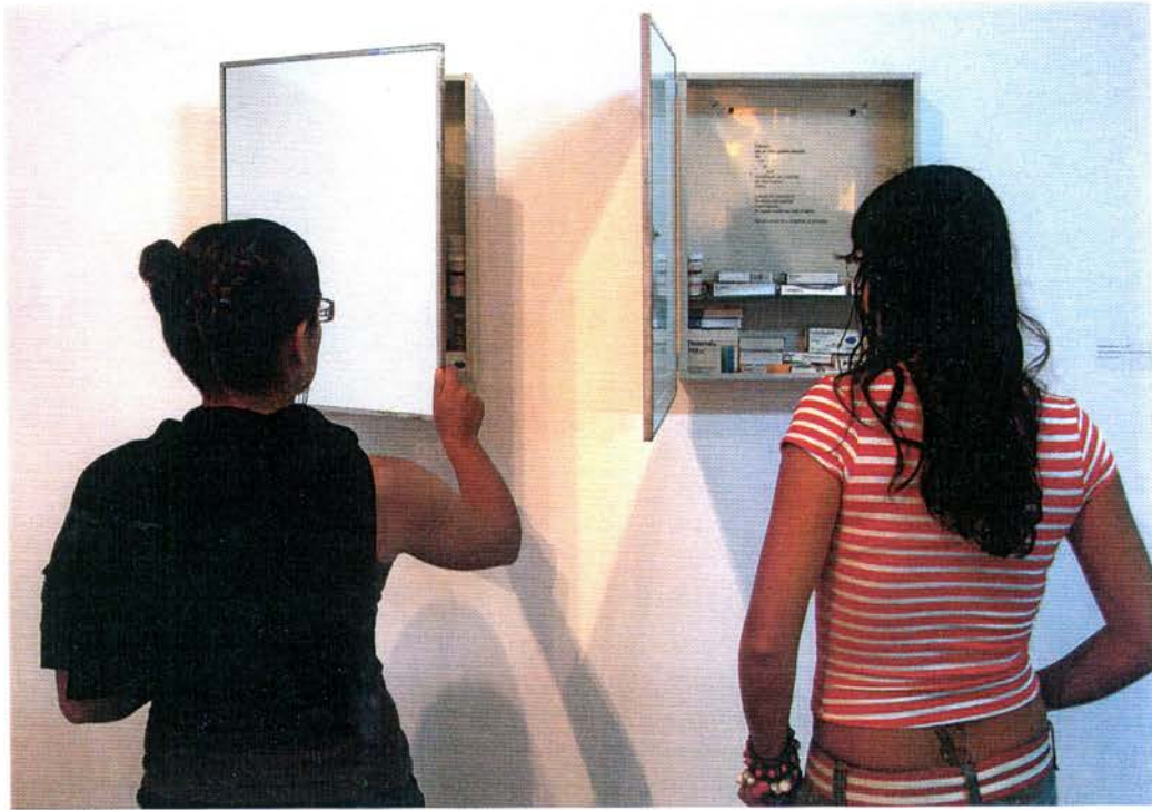
Poliverso Andróctono 1 y 5, 1997 Gabinets de baño, poemas sobre acetato, medicamentos. 60 cm. x 42 cm. x 15 cm. (cada uno)